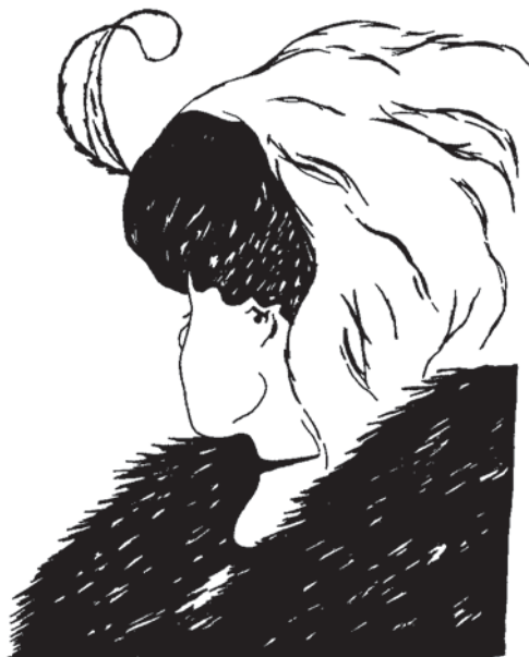
Obrázek 2. Moje žena a má tchyně (podle kresby W. E. Hilla).

Takže to, co materialisté považují za pouhý epifenomén, je reálnou věcí s kauzální účinností. Když tedy pohlédneme na zdraví a léčbu optikou kvantové fyziky, vládnou okamžitě oba, léčitel i pacient, silou hierarchické kauzality a potenciální mocí vybrat si zdraví, nikoliv nemoc. Je třeba jen naučit se tuto volbu uskutečnit se všemi jemnostmi, které jsou její součástí. A když se to naučíme (viz kapitola 6), zjistíme, proč je tato samoléčba tradičně nazývána uzdravením skrze působení vyšší mocnosti, ducha nebo boha – proto, že nás vyzvedává z našeho každodenního izolovaného kokonu existence do celostní, nelokální úrovně bytí.