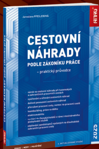
EDICE PRÁCE | MZDY | POJIŠTĚNÍ