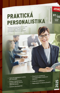
DVOUMĚSÍČNÍK PRAKTICKÁ PERSONALISTIKA