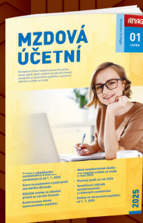
MĚSÍČNÍK MZDOVÁ ÚČETNÍ