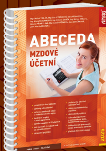
EDICE PRÁCE | MZDY | POJIŠTĚNÍ