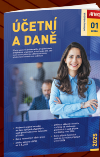
MĚSÍČNÍK ÚČETNÍ A DANĚ