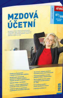
MĚSÍČNÍK MZDOVÁ ÚČETNÍ