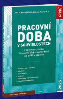
EDICE PRÁCE | MZDY | POJIŠTĚNÍ