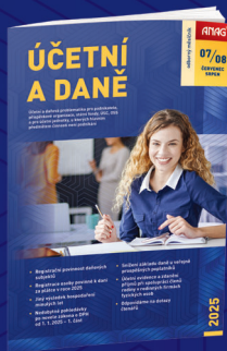
MĚSÍČNÍK ÚČETNÍ A DANĚ