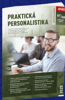
DVOUMĚSÍČNÍK PRAKTICKÁ PERSONALISTIKA