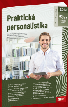
DVOUMĚSÍČNÍK PRAKTICKÁ PERSONALISTIKA