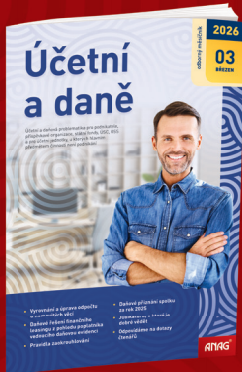
MĚSÍČNÍK ÚČETNÍ A DANĚ