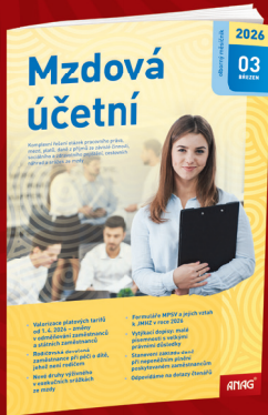
MĚSÍČNÍK MZDOVÁ ÚČETNÍ