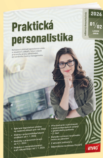
DVOUMĚSÍČNÍK PRAKTICKÁ PERSONALISTIKA