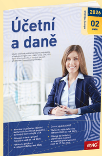
MĚSÍČNÍK ÚČETNÍ A DANĚ