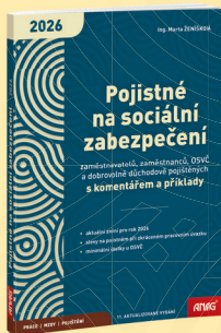
EDICE PRÁCE | MZDY | POJIŠTĚNÍ