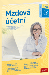
MĚSÍČNÍK MZDOVÁ ÚČETNÍ